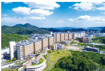
(伊都キャンパス全景)